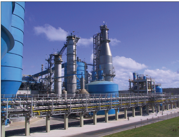
Zellstoffanlage im brasilianischen Aracruz – automatisiert von Andritz Automation unter Beteiligung von Weiss Automation e.U.

Angewandte Technik durch Applikationsprogrammierung spezifischer Software-Tools und der virtuellen Gesamtplanung großer wie kleiner Anlagen. Dazu gehören das Analysieren und Realisieren sowie die Synthese steuer- und regeltechnischer Probleme beim Bau von Industrieanlagen und Maschinen. Außer-