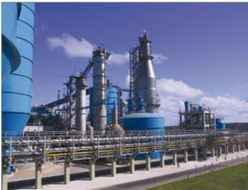
Zellstoffanlage im brasilianischen Aracruz – automatisiert von Andritz Automation unter Beteiligung von Weiss Automation e.U.

rungstechnik durch Applikationsprogrammierung spezifischer Software-Tools und der virtuellen Gesamtplanung großer wie kleiner Anlagen. Dazu gehören das Analysieren und Realisieren sowie die Synthese steuer- und regeltechnischer Probleme beim Bau von Industrieanlagen und Maschinen. Außer-